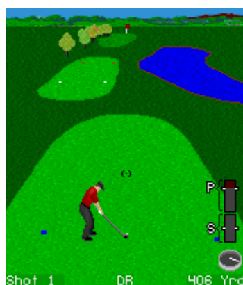
"Golf Channel: Mobile Tour"