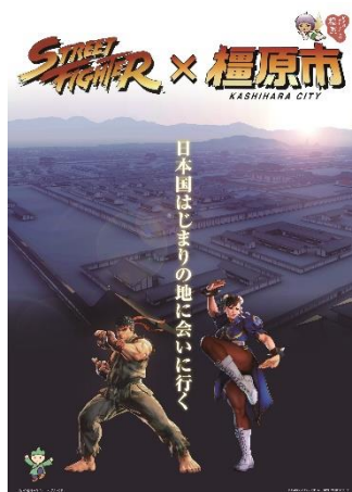
コラボポスターのデザイン

今後も当社は、「遊文化をクリエイトする感性開発企業」の企業理念のもと、気候変動をはじめとする社会課題の解決に積極的取り組み、ステークホルダーの皆様との信頼関係ならびに地球環境との調和のもとでの、持続的な成長を目指してまいります。