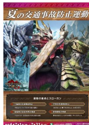
チラシのデザイン