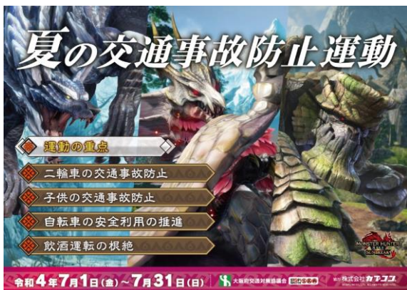
ポスターのデザイン

今後も当社は、「遊文化をクリエイトする感性開発企業」の企業理念のもと、気候変動をはじめとする社会課題の解決に積極的に取り組み、ステークホルダーの皆様との信頼関係ならびに地球環境との調和のもとでの、持続的な成長を目指してまいります。