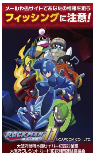
ステッカーのデザイン