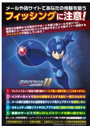
チラシのデザイン