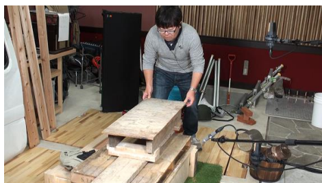
フォーリーステージでの録音の様子