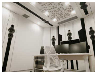
新設された2基のサウンドスタジオ