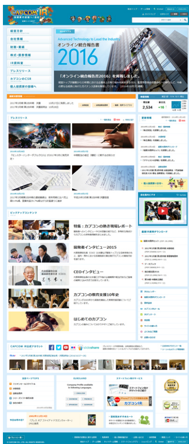
IR サイト トップページ