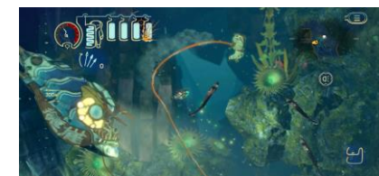
『深世海 Into the Depths』