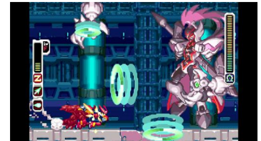
『ロックマン ゼロ&ゼクス ダブルヒーローコレクション』