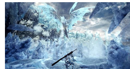
『モンスターハンターワールド: アイスボーン』