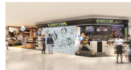
「CAPCOM STORE TOKYO」 (渋谷)