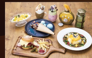
● アミューズメント施設(コラボカフェ)