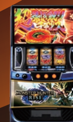
● スマスロ「モンスターハンターライズ」