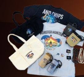
● アパレル「AND CHIPS」