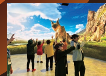
● 大阪・関西万博「モンスターハンター ブリッジ」