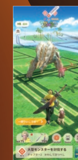
● モバイルタイトル「Monster Hunter Now」

© 2020 Constantin Film Production GmbH © Constantin Film Vertrieb GmbH