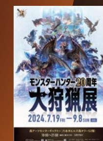
● モンスターハンター20周年「大狩猟展」