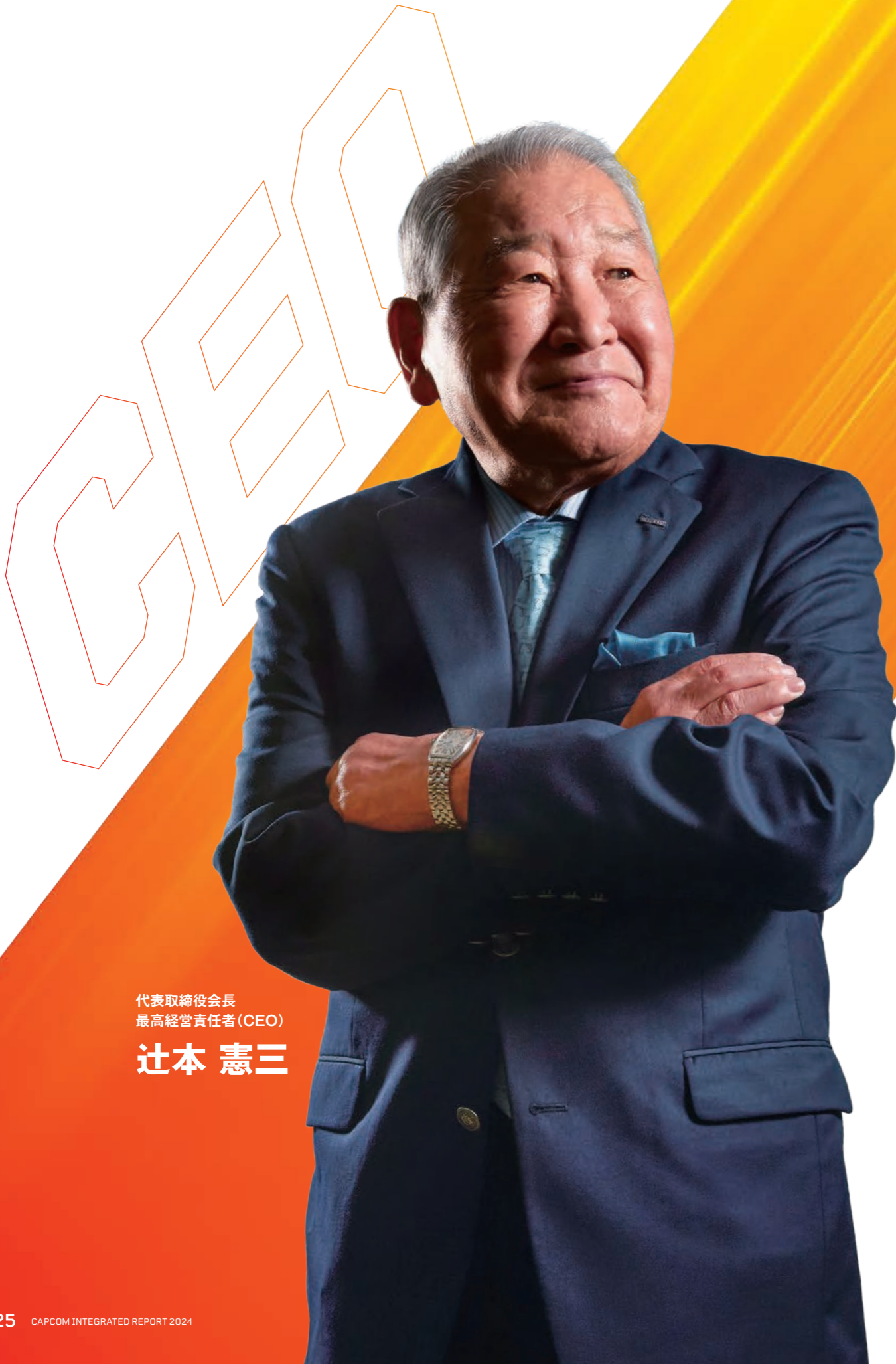
代表取締役会長 最高経営責任者 (CEO)