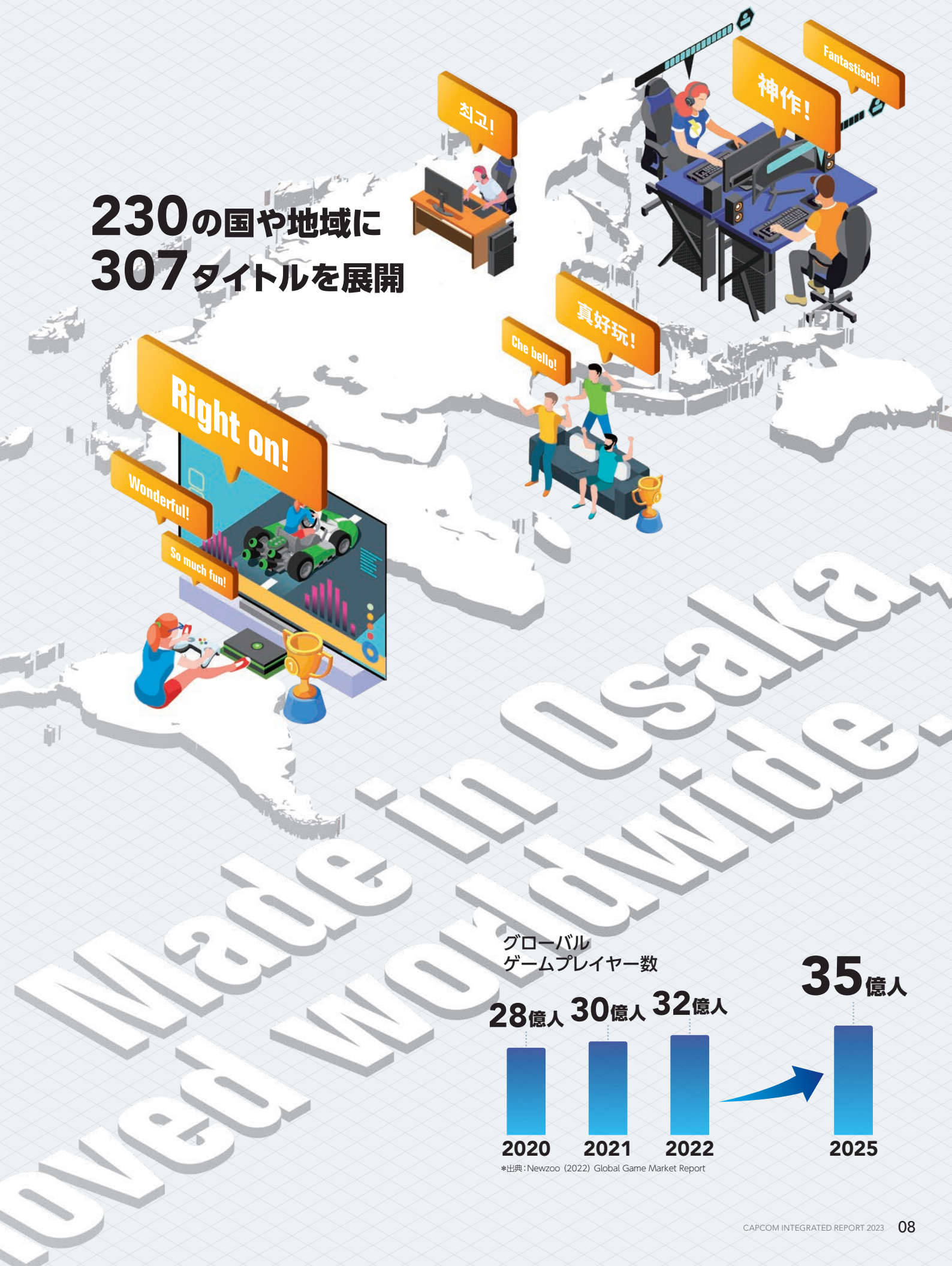
グローバル ゲームプレイヤー数