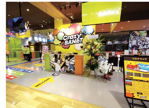
『クレイジーバナネット イオンモール新居浜店』(愛媛県)

この結果、売上高は91億69百万円(前年同期比25.2%増)、営業利益は11億28百万円(前年同期比66.5%増)となりました。