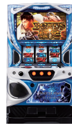
『モンスターハンターワールド：アイスボーン』

パチスロ市場がスマートパチスロのけん引により好調を維持している環境下、当社グループのスマートパチスロ第一弾となる『戦国BASARA GIGA』を8月に発売し、15千台を販売しました。