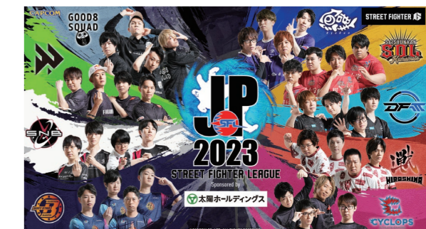
『ストリートファイターリーグ：Pro-JP 2023』

この結果、売上高は18億91百万円(前年同期比28.8%減)、営業利益は6億14百万円(前年同期比51.2%減)となりました。