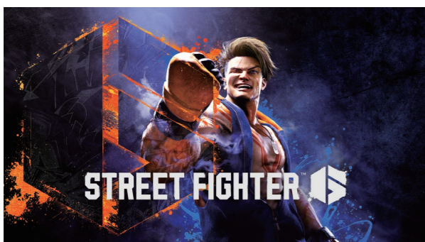
『ストリートファイター6』

この結果、売上高は612億75百万円(前年同期比69.9%増)、営業利益は345億3百万円(前年同期比58.1%増)となりました。