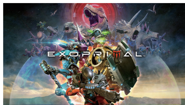
『エグゾプライマル』